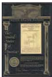
Brevetto U.S.A. No. 5,973,595