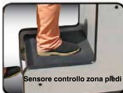
Sensore controllo zona piedi