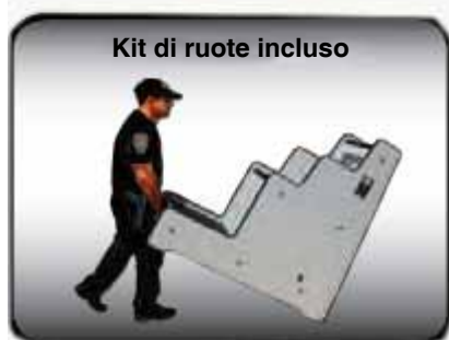
Kit di ruote incluso