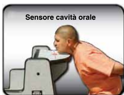
Sensore cavità orale

Previene l'occultamento di oggetti metallici pericolosi (vedi foto) e rende più sicuro il luogo di detenzione.